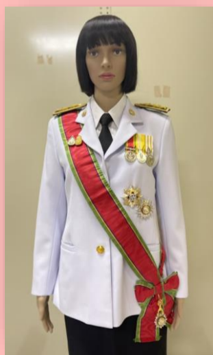
ตัวอย่างที่ ๒ ผู้ได้รับพระราชทาน ม.ว.ม. และ ป.ช. (สวมสายสะพาย ป.ช. และประดับดารา ม.ว.ม. ให้สูงกว่าดารา ป.ช.)