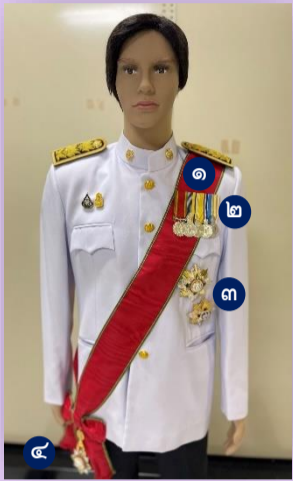
ผู้ได้รับพระราชทาน ม.ป.ช. และ ม.ว.ม.